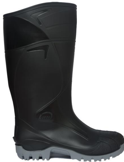
Foto lateral del calzado