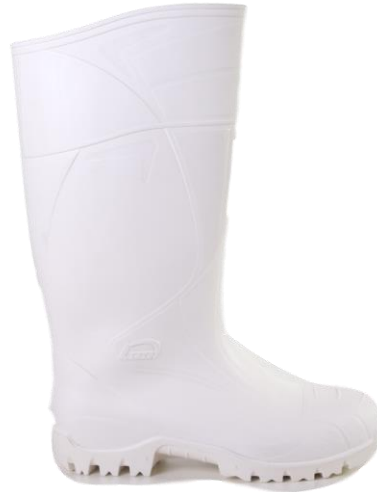
Foto lateral del calzado