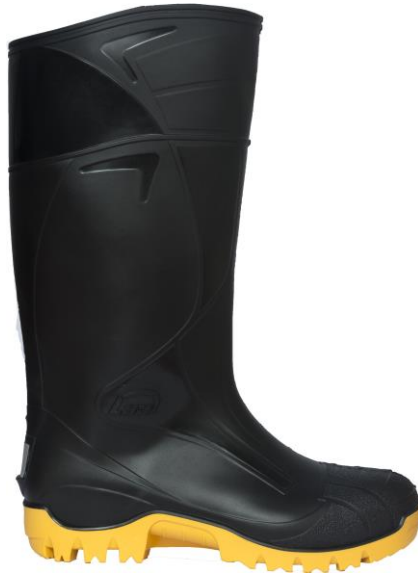
Foto lateral del calzado