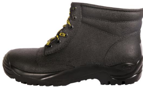
Foto lateral del calzado