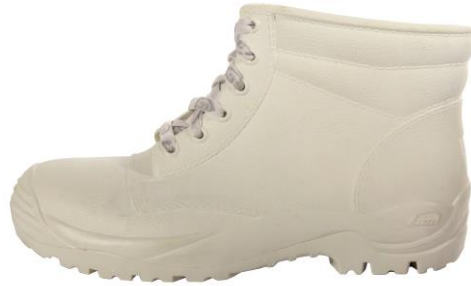
Foto lateral del calzado