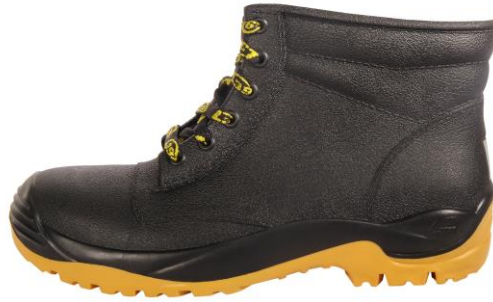
Foto lateral del calzado