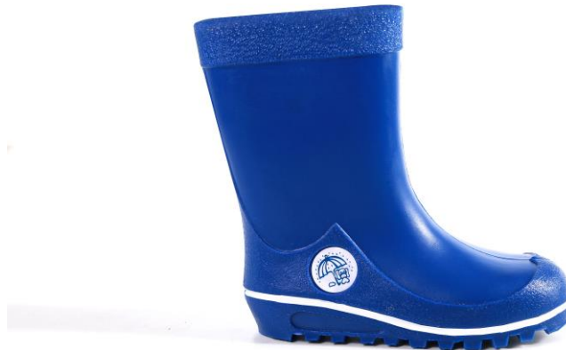
Foto lateral del calzado