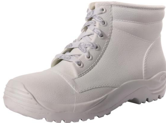
Foto lateral del calzado