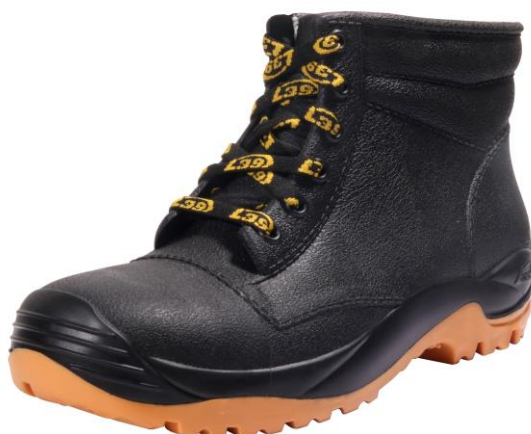
Foto lateral del calzado